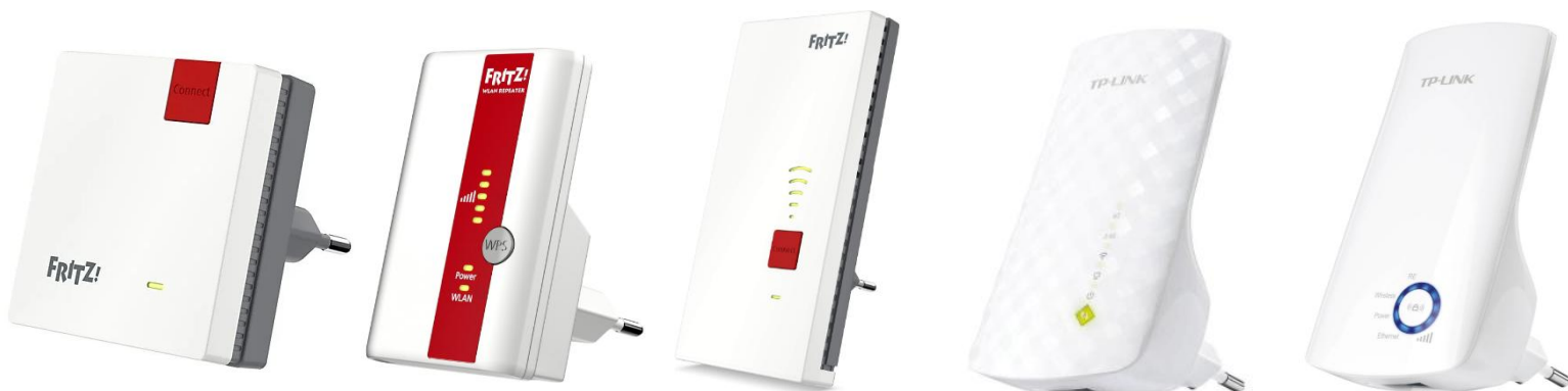
Abbildung 6 – Beispiele verschiedener WLAN-Repeater

In der Nähe Ihrer PV-Komponenten oder beim bzw. im Zählerschrank befindet sich ein WLAN-Repeater. Ziehen Sie diesen für ca. 30 Sekunden aus der Steckdose.