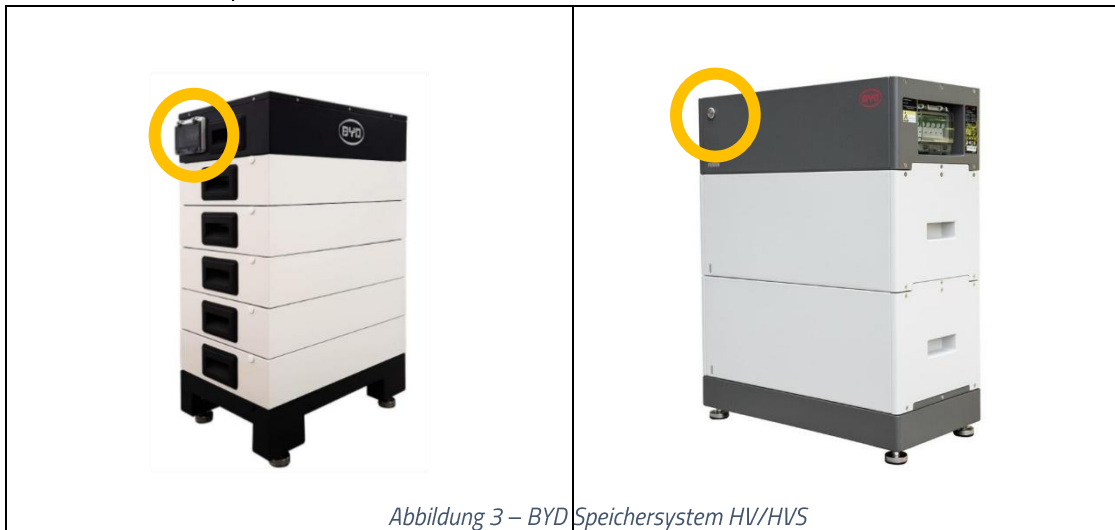
Abbildung 3 – BYD Speichersystem HV/HVS