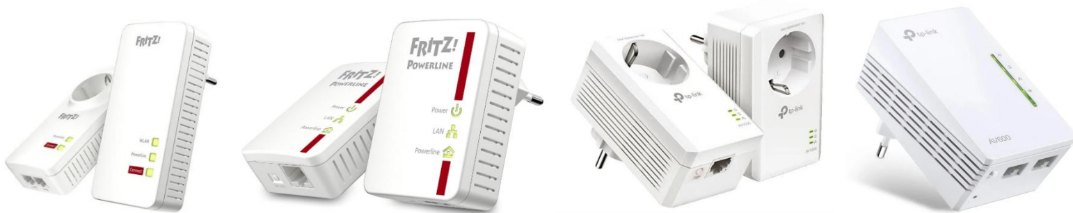
Abbildung 5 – Beispiele verschiedener Powerline

Powerline bestehen immer aus einem Set , daher müssen Sie zum Neustarten immer beide Powerline für ca. 30 Sekunden aus der Steckdose ziehen. Einen finden Sie bei Ihren PV-Komponenten oder beim bzw. im Zählerschrank. (Abbildung 8, auf Seite 4, zeigt einen typischen Aufbau) Den zweiten finden Sie bei Ihrem Router. Für eine ordnungsgemäße Übertragung sind Verlängerungskabel / Mehrfachsteckdosenleisten für die Powerline zu vermeiden. Nach dem Wiedereinstecken und nachdem die PV-Anlage wieder hochgefahren ist, sollten bei beiden Powerline alle LEDs leuchten.