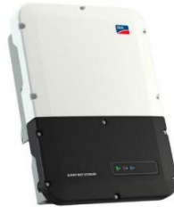
Abbildung 1 – SMA-Wechselrichter