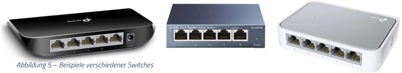
Abbildung 5 – Beispiele verschiedener Switches

Switche befinden sich meistens in Netzwerkschränken, beim oder im Zählerschrank oder auch bei Ihrem Wechselrichter / Speicher. Ziehen Sie bitte dessen Netzstecker für ca. 30 Sekunden aus der Steckdose.