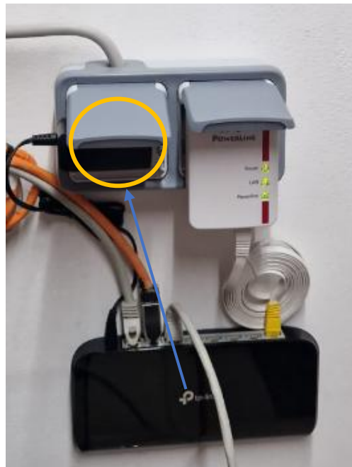
Abbildung 6 – Beispiel typischer Aufbau Switches mit Powerline

Switche befinden sich meistens in Netzwerkschränken, beim oder im Zählerschrank oder auch bei Ihrem Wechselrichter / Speicher. Ziehen Sie bitte dessen Netzstecker für ca. 30 Sekunden aus der Steckdose.