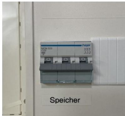
Abbildung 2 – Sicherungen im Schaltschrank/Zählerschrank