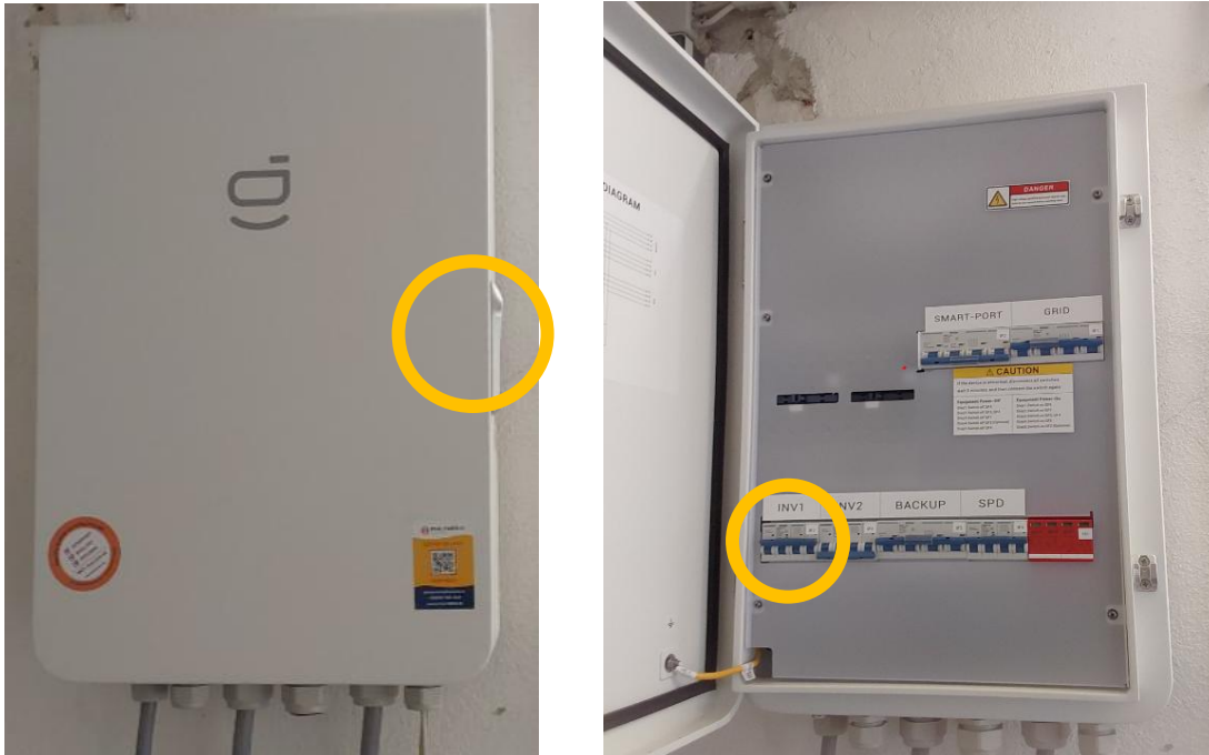
Abbildung 3 – Sicherungen im Energie Gateway