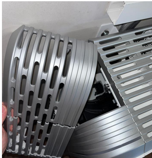
Abbildung 2 – Sigenergy Wechselrichter Drehschalter