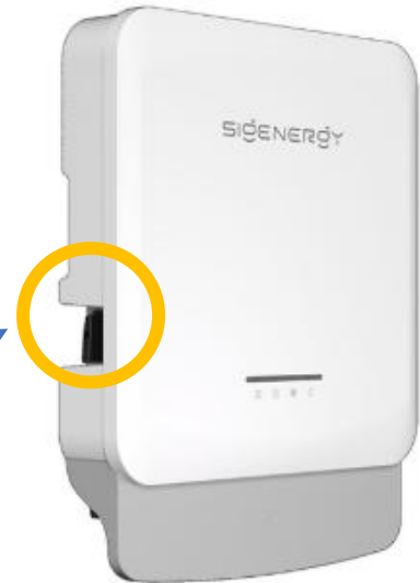
Abbildung 1 – Sigenergy Wechselrichter 4.2-5.0