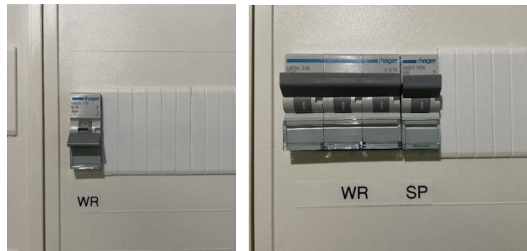
Abbildung 3 – Beispiel Sicherungen im Schaltschrank/Zählerschrank