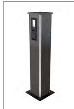
Ladesäule „Walther-Werke“ Ecolectra 250