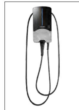
Wallbox „Webasto Pure“