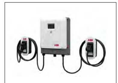
Schnelllader „ABB 24 CCS“