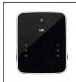
Wallbox „ABL eMH3“