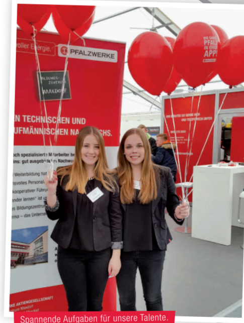
Spannende Aufgaben für unsere Talente.

Unsere Auszubildenden betreuen ihre Projekte von der Planung über die Kalkulation bis hin zur Abrechnung selbst. Dabei lernen sie, bereichsübergreifend zu arbeiten, Verantwortung zu übernehmen sowie unternehmerisch zu denken und zu handeln.