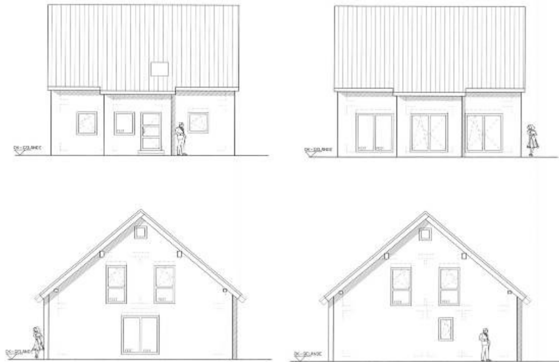
Abbildung 1-1 Seitenansichten des Musterhauses

Am Beispiel eines Musterhauses werden die Berechnungen durchgeführt. Es wird WABAU Massiv-Haus Typ 235 zu Grunde gelegt. Die daraus konzeptionierten Plus-Energiehäuser werden unter dem Namen WABAU Massiv-Haus Typ 235 PLUS vermarktet.